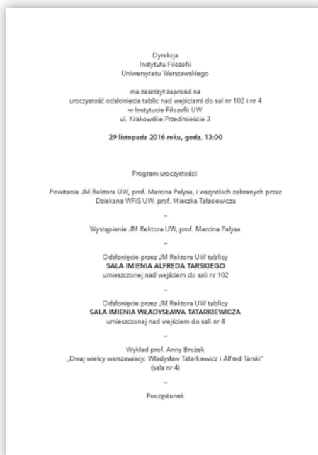
Zaproszenie – strona 2

W uroczystości odsłonięcia tablic wzięli udział – oprócz JM Rektora UW – przedstawiciele władz Wydziału Filozofii i Socjologii, przedstawiciele władz Instytutu Filozofii i Instytutu Socjologii oraz społeczność Instytutu Filozofii (wykładowcy i studenci). Uroczystość rozpoczęła się od wygłoszenia okolicznościowych przemówień, m.in. przez JM Rektora UW.