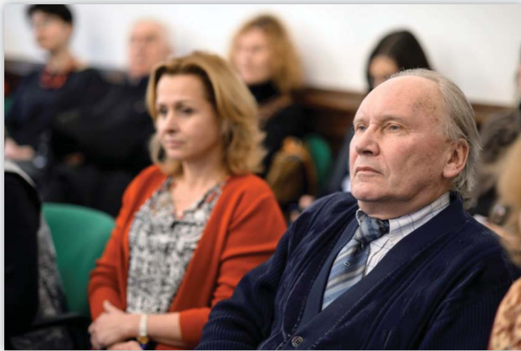
Publiczność słuchająca wykładu

W wykładzie przybliżone zostały sylwetki filozofów: ich dzieje, dokonania na gruncie filozofii, związki ze Szkołą Lwowsko-Warszawską i Warszawą.