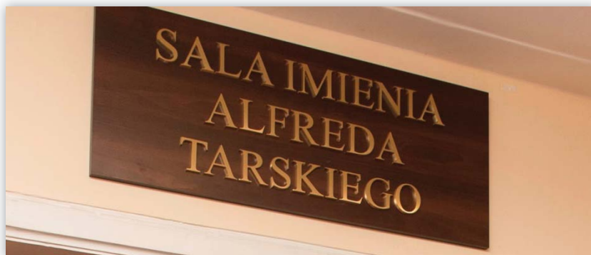
Tablica nad salą nr 102