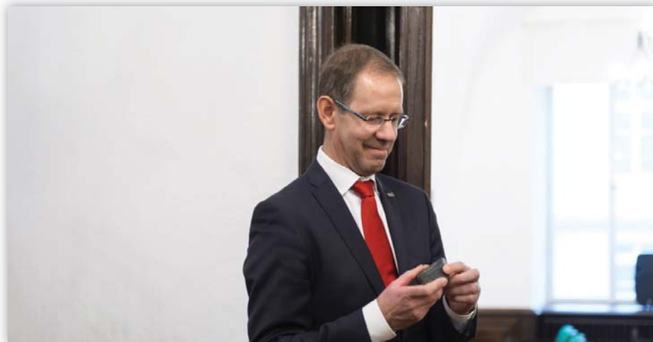
JM Rektor UW z kamieniem filozoficznym