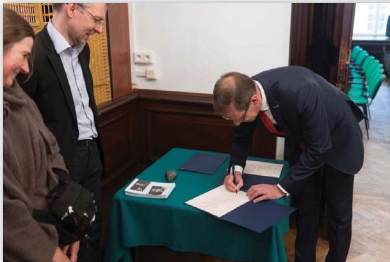
Podpisanie aktów nadania imion salom w Instytucie przez JM Rektora UW

JM Rektor UW podpisał akty nadania imion salom wykładowym w Instytucie.