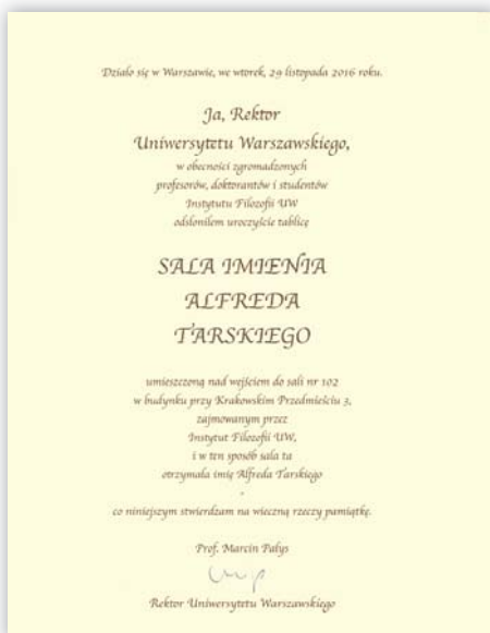
Akt nadania imienia sali nr 102