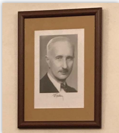
Portret Władysława Tatarkiewicza w sali nr 4

W salach nr 4 i 102 zawisły portrety patronów, podarowane przez profesora Jacka Jadackiego.