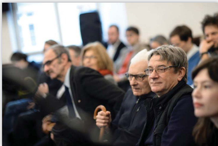
Publiczność słuchająca wykładu